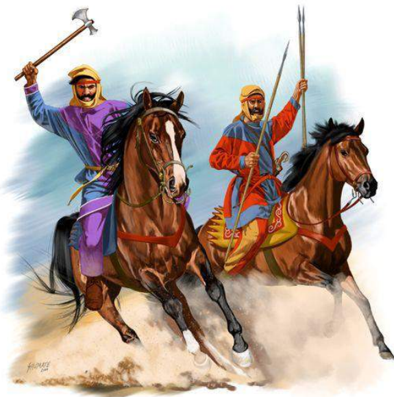
Ilustración 7: Familiares armados de la segunda mitad del siglo IV a.C, los caballeros persas privilegiaban armas a distancia como arcos y jabalinas. En cuerpo a cuerpo las armas más populares eran las dagas largas (akinakes) y hachas (sagaris), una sagaris casi mata a Alejandro Magno en la batalla del Gránico. Como miembros de la Spada, los uniformes de combate de los Familiares son de estilo medo y muestran el color de la unidad a la que pertenece su respectivo jinete. Ilustración de Johnny Shumate.

hombres de confianza, ser un ‘Familiar’ del Gran Rey era un título nobiliario no hereditario que dependía de la cercanía personal entre el Rey y el noble, un Familiar podía ser nombrado o destituido por el Rey en cualquier momento por razones personales, ya que era el vínculo personal lo que más importaba y lo que los jerarquizaba internamente (Farrokh, Shadows of the Desert , 2007, pág. 40), mientras mayor su cercanía al Rey mayor su importancia, por ejemplo, Darío sirvió como ‘Portador del Gorytos 12 del Rey’ con Ciro y como ‘Portador de la Lanza del Rey’ con Cambises, lo que nos da a entender que tenía un lugar importante dentro de la corte real.