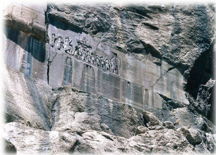
Ilustración 1: Inscripción de Behistún.

Es muy raro encontrar narraciones históricas escritas legadas por la Persia Aqueménida. Gran parte de las fuentes primarias consistían en cueros de animal escritos, enrollados y almacenados en un recinto especial de la ciudadela de Persépolis, que se perdieron durante el incendio que