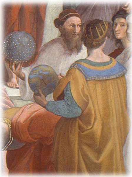
Ilustración 2: Zarathustra en la Escuela de Atenas (1511), basado en el rostro de Baldassare Castiglione. Pintado por Rafael Sanzio.

La principal fuente para resolver esta problemática son los Gathas . El estudio de estos