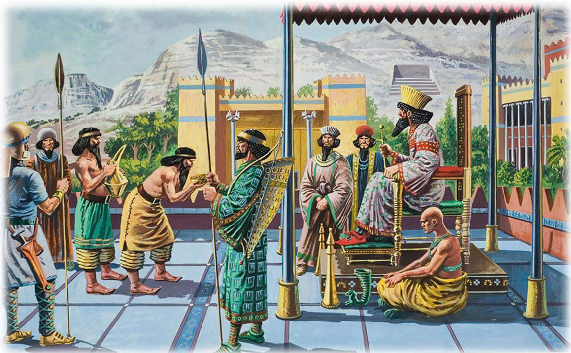
Darío I recibiendo emisarios con tributos durante la ceremonia del Nowruz, basado en los relieves de Persépolis.