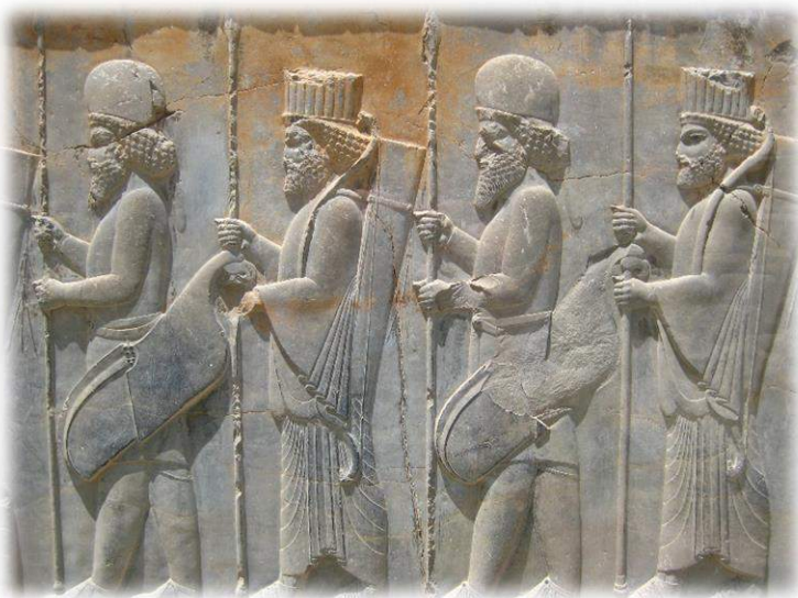
Ilustración 6: Portadores de Manzana representados en los escalones del salón de recepciones de Persépolis (Apadana). Nótese la mezcla de vestimentas medas (primero y tercer de izquierda a derecha) y elamo-persas (segundo y cuarto).

destinados lejos de su madre patria, protegiendo la Pax Pérsica y garantizando la justicia del Rey; los famosos y mal llamados ‘Diez mil Inmortales’ 9 , una división ( baivarabam ) considerados los mejores y más valientes soldados de a pie del Imperio, de estos, un regimiento o hazarbam (1.000 hombres) servía como Guardia Real, llamada ‘Lanceros Personales del Rey’ ( Arstibara ). El comandante de este hazarbam recibía la denominación de hazarpatis , al igual que cualquier otro comandante de regimiento, pero el hazarpatis del imperio un poder muy superior al que su rango sugiere, ya que era designado personalmente por el Gran Rey y detentaba el mando supremo de la Spada , siendo uno de los hombres más influyentes de la corte, incluso sabemos que en la época más tardía el hazarpatis imperial llegó a desempeñar las funciones similares a las de un Primer Ministro 10 (Farrokh, Shadows of the Desert , 2007, pág. 40).