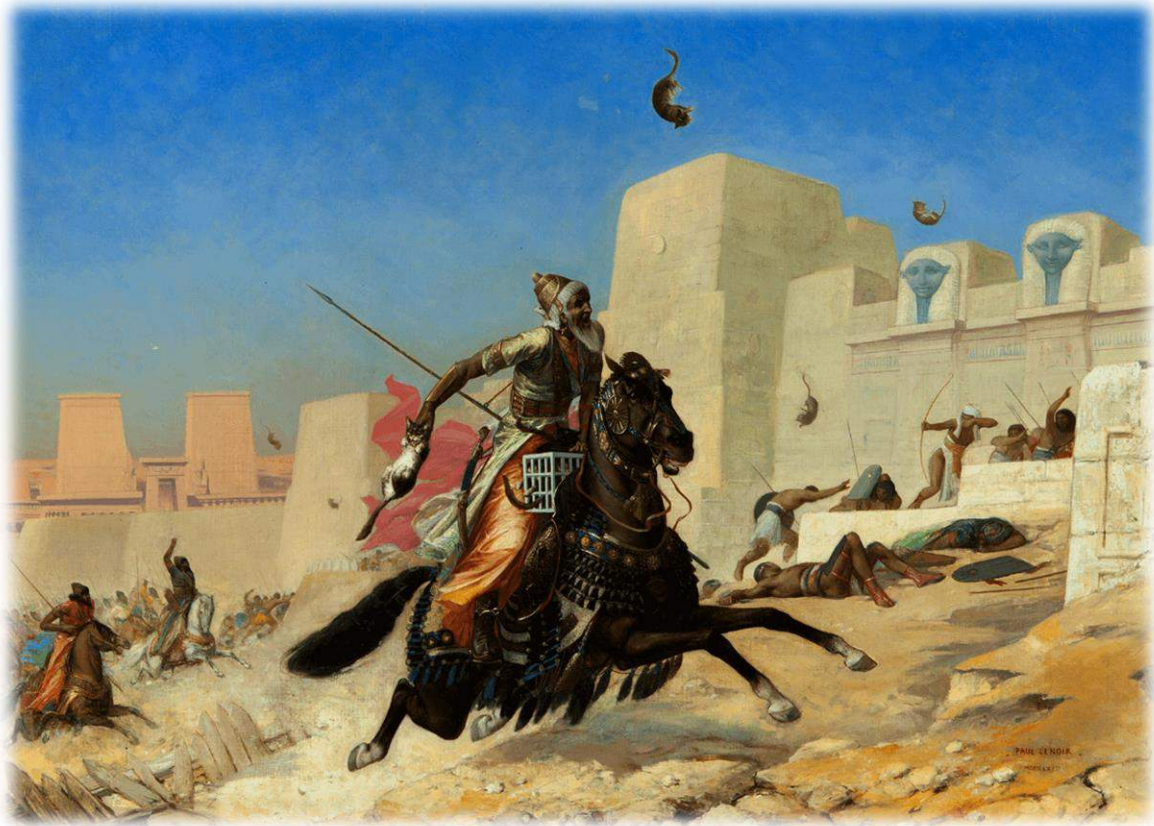
Ilustración 8: Cambises y sus tropas arrojando gatos a las defensas egipcias en Pelusio. Pintura de Paul-Marie Lenoir, 1872.

miedo a dañar a sus animales sagrados, esta anécdota probablemente nunca haya ocurrido ya que sólo es mencionada por Polieno.