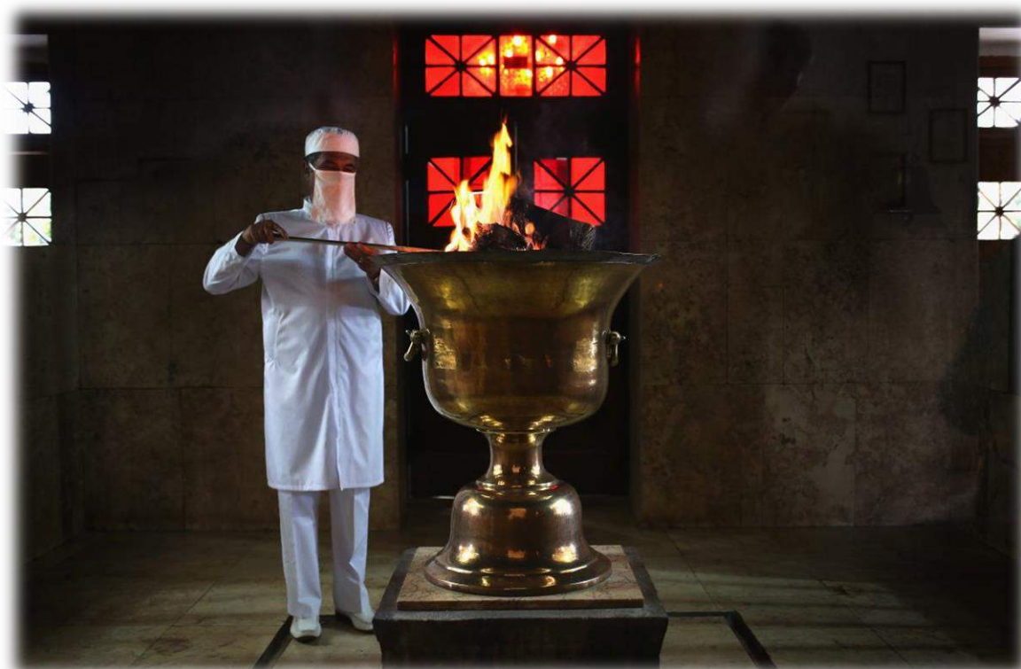
Ilustración 4: Un Mobad (Sacerdote zoroastrista) custodia el Atash Behram (Fuego de la Victoria), la forma más elevada de Fuego Eterno en el zoroastrismo actual. Foto tomada en el templo de Yazd, donde sus clérigos reclaman que la llama arde desde el siglo V.

A partir de Darío, podemos evidenciar que todas las inscripciones reales persas mantienen la misma forma de presentación, dedicando a Ahura Mazda sus mayores logros, lo que es un fuerte argumento para considerar al zoroastrismo como una fuerte influencia al interior de la corte del Gran Rey. Incluso cuando la ortodoxia zoroastrista se vio amenazada por las prácticas sincréticas de los aqueménidas, Ahura Mazda nunca perdió su puesto hegemónico en el panteón real, el mejor ejemplo de esto se dio en el gobierno de Artajerjes II, donde el culto de Anahita , diosa de la fertilidad, se esparció por el imperio bajo patronazgo real y sobretodo de mano de la reina madre, pero incluso esto no impidió a Ahura Mazda mantenerse como la figura central de entre las deidades de la corte, los documentos reales seguían siendo consagrados en nombre de Ahura Mazda , que a pesar de compartir el patronato con Anahita en documentos del reinado de Artajerjes (Briant, 1982), siempre se le invocaba antes que la diosa de la fertilidad, lo que solo nos prueba la consagración y legitimidad del zoroastrismo como símbolo de poder y autoridad religiosa.