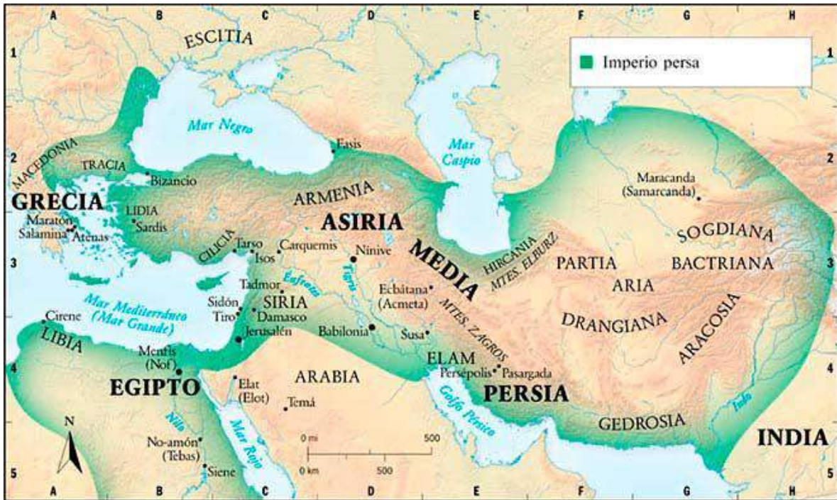
Ilustración 11: Mapa del Imperio en su máxima extensión, durante el reinado de Darío.

Ciro es considerado con mérito como el fundador del imperio persa aqueménida y símbolo de la nación irania hasta el día de hoy, mientras su hijo Cambises ha sido recordado malamente por la Historia, quizás sin merecerlo. Pero es Darío quien reformó la Persia Aqueménida hasta darle una forma que nosotros podemos reconocer como un verdadero imperio. Con un sistema estatal de obras públicas, un entramado legal universal, el primer sistema monetario estandarizado del mundo, un reformado sistema burocrático, un rescate de la antigua cultura persa en la corte en detrimento de la meda, una nueva capital para los persas y una nueva religión cortesana que funcionó como soporte ideológico para el reformado imperio.