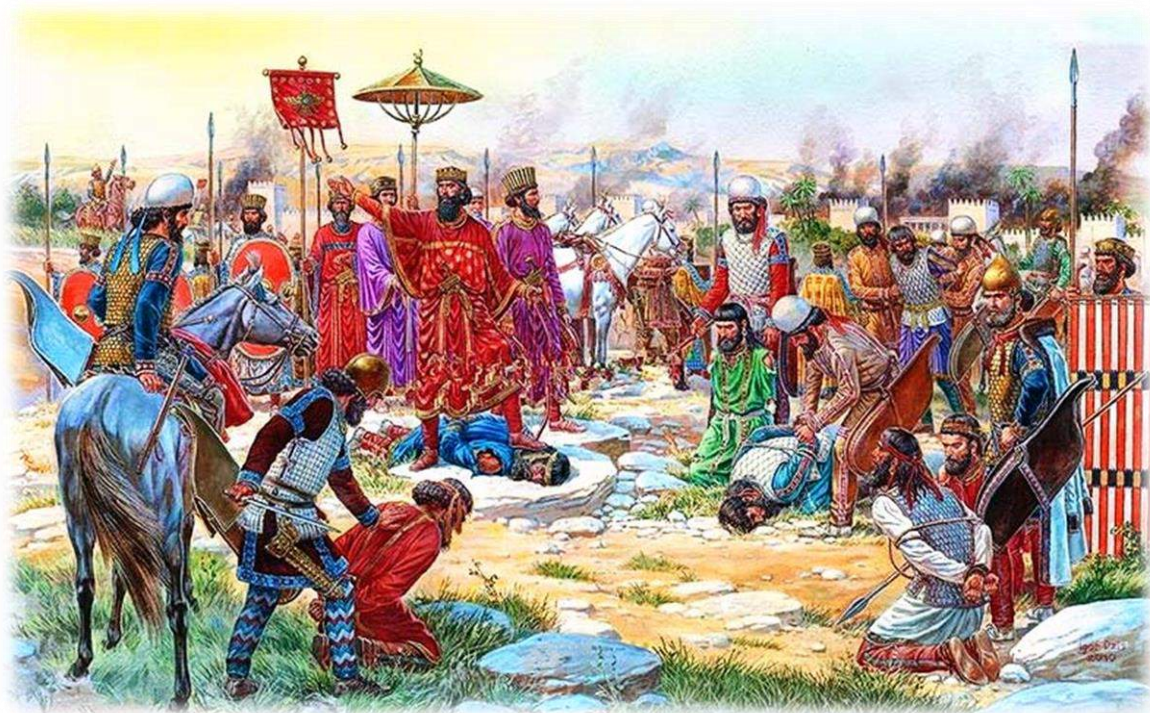
Ilustración 10: Rendición de los “rebeldes” elamitas ante Darío por el ilustrador ucraniano Igor Dzis (2010), basado en el relieve de Behistún. Nótense las ropas medas vestidas por las tropas en campaña, tanto entre “rebeldes” como entre las tropas del Gran Rey, Darío y su séquito por su lado llevan las tradicionales túnicas elamo-persas que pasaron a ser la nueva norma de la corte.

La contra-revuelta triunfó y Darío siendo uno de los mejores candidatos para reclamar la legitimidad al trono como pariente de sangre y Familiar de confianza de Cambises, fue coronado Gran Rey de Persia. La victoria de Darío fue celebrada por los persas de ahí en adelante, según Heródoto y Ctesias (Nichols, 2008, pág. 93), en una fiesta anual llamada ‘masacre de magos’ (Gr. Magophonia ), celebrada el día de la muerte del usurpador, que según las fuentes antiguas era un mago usurpando el rol de Bardiya , según Heródoto el día de la muerte del usurpador se dio tal caza a los sacerdotes “ que si no hubiera llegado la noche, no quedarían ya magos ” y que para conmemorar ese día los persas celebraban con grandes banquetes a los que ningún mago podía asistir o incluso mostrarse en público (III, LXXIX); Ctesias por su parte no aporta nueva información, ya que sólo nos dice que era un festival para celebrar la muerte del mago Sphendadates/Gaumata/Bardiya .